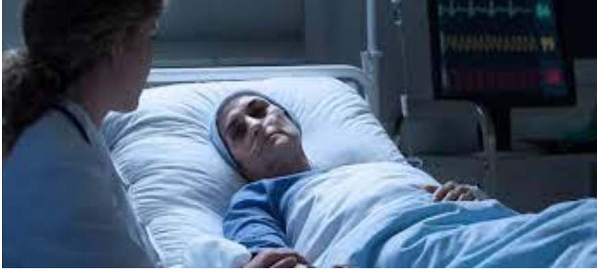
شكل ( ٣ - ١ ) بوضوح الارهاق على الجسم بعد العلاج الاشعاعي

يتلاشى تدريجياً بعد نهاية علاجك. ويمكنك أن تساعد نفسك أثناء فترة العلاج بالإشعاع، وذلك بتجنب الإجهاد. فإذا شعرت بتعب قلل من نشاطاتك وحركتك وأركن للاسترخاء. ولا تفكر بأنه يجب عليم القيام بكل ما كنت تفعله قبل إصابتك بالمرض وحاول أن تنام لفترة أطول في الليل، وأثناء النهار إذا استطعت. وإذا كنت تعمل بوظيفة بدوام كامل وأردت أن تستمر فيها، حاول بكل تأكيد فعل ذلك. ومع أن الزيارات للعلاج تستغرق وقتاً طويلاً، بمكانك أن تطلب من مكتب طبيبك أو قسم العلاج بالإشعاع مساعدتك وذلك بأخذ دوامك بعين الاعتبار عند تحديد مواعيد العلاج.