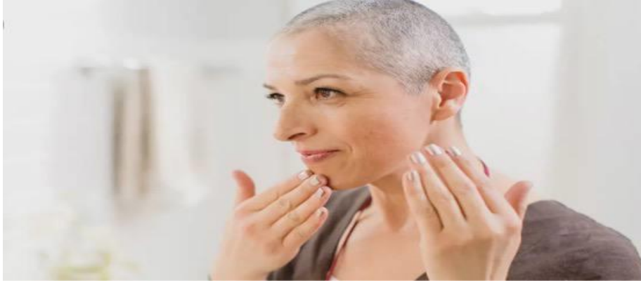
شكل يوضح تأثير العلاج الإشعاعي على تساقط الشعر (٣-٣)

إذا كانت مساحة من شعرك تخضع للعلاج، قد تفقد جزءاً منه أو كله أثناء العلاج بالإشعاع، ويجد بعض المرضى أن شعرهم ينبت من جديد بعد نهاية العلاج ولكنه قد يصعب التكيف مع فقدان الشعر، سواء أكان من فروة الرأس أم الوجه أم الجسم. قد ترغب في تغطية رأسك بطاقيّة أو عمامة أو منديل أثناء فترة العلاج، ويفضل البعض استخدام شعراً اصطناعياً. وإذا نويت شراء شعراً اصطناعياً، من الأفضل اختياره في مرحلة مبكرة من علاجك، لتتمكن من المطابقة بينه وبين شعرك الطبيعي من حيث اللون والشكل.