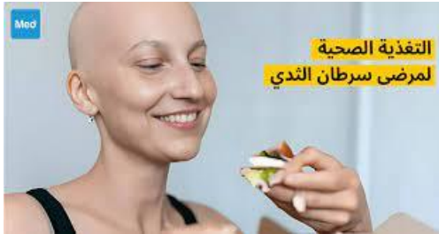
شكل ( ٣ - ١٦ )

ويمكن أن يكون إتباع نظام غذائي متنوع وشامل بكميات كافية هو دفاعك الأقوى ضد المشاكل الغذائية التي قد تنجم عن العلاج بالإشعاع.