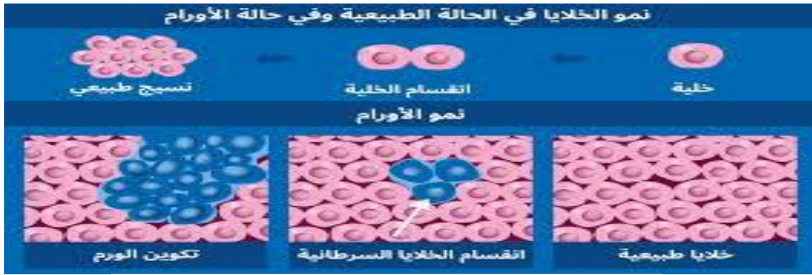
شكل (١-٣) تأثير الإشعاع على خلايا الجسم

أو أي ألم غير عادي أثناء فترة علاجه. أن أغلب الآثار الجانبية التي تصيب المرضى أثناء العلاج بالإشعاع ليست خطيرة، مع إنها مزعجة وغالباً ما تختفي خلال لبعة أسابيع من نهاية العلاج وقد يستمر بعضها لمدة أطول. غير أن العديد من المرضى لا يعانون من أية آثار جانبية على الإطلاق. وفي قسم آخر من هذا الكتيب (إنظر " التعامل مع الآثار الجانبية ) ستجد بعض النصائح المتعلقة بالآثار الجانبية المختلفة التي يمكن أن تتعرض لها أثناء العلاج وبعدها.