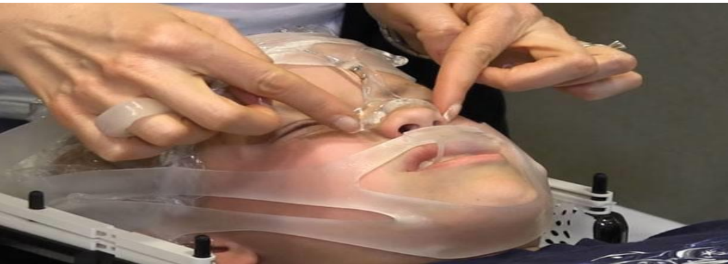
شكل طريقة العلاج في منطقة الرأس ( ٣-٥ )

ما هي الآثار الجانبية على منطقة الرأس والرقبة؟ ( ٣ - ١٠ )