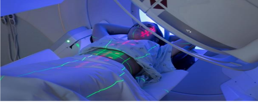
شكل ( ٢ - ١ ) يوضح عملية الغرس

واهم من كل شيء آخر، يجب أن تشعر بحرية في توجيه أية أسئلة ترد إلى ذهنك إلى طبيبك المعالج أو أخصائي الإشعاع أو ممرضك ، فهم الوحيدون القادرون على نصحك وتوجيهك نحو المسار الصحيح بشأن العلاج وأثاره الجانبية والعناية بنفسك في المنزل، أو أية تساؤلات أخرى قد تكون لديك.